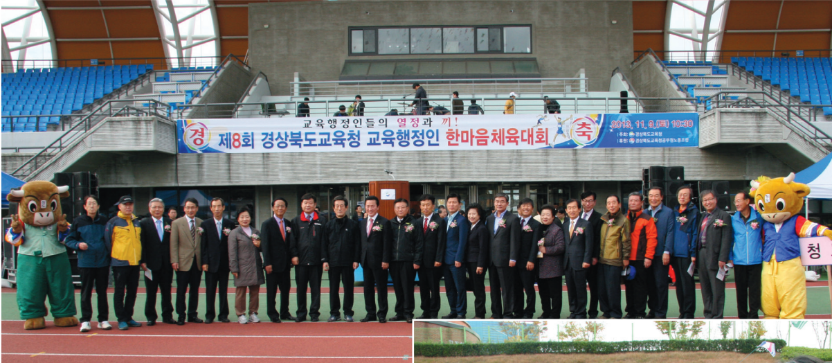
제8회 일시 : 2013. 11. 9(토) 10:00 장소 : 경산 시민운동장