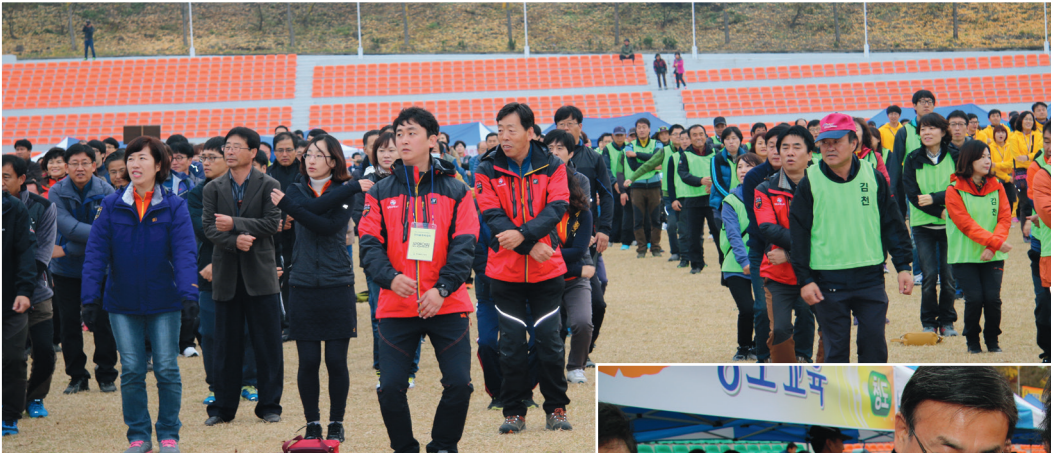
제9회 일시 : 2014. 11. 8(토) 10:30 장소 : 의성 종합운동장