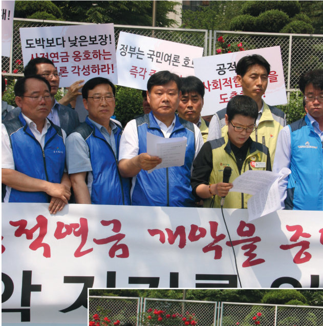
○ 공적연금 개악 저지를 위한 공투본 출범 기자회견 일시 : 2014. 5. 29(목) 10:30 장소 : 안전행정부 정문