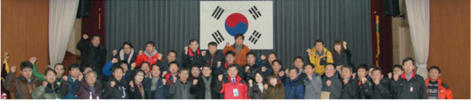
대의원 대회 개최