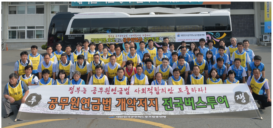
○ 공무원연금 개악저지 전국 버스투어 홍보 및 출근 선전전 일시 : 2014. 6. 19(목) 07:00 장소 : 경북교육청 및 경북도청